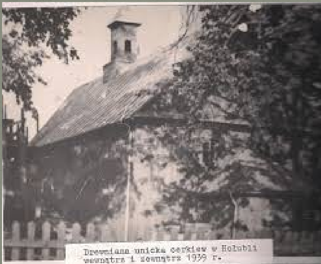
Drewniana unicka cerkiew w Hołubli wewnątrz i zewnątrz 1939 r.